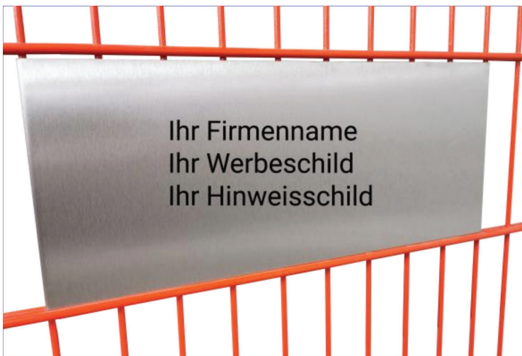
Zaunschild | Firmenschild | Werbeschild