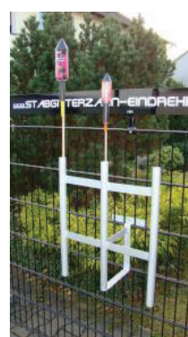
Eindrehhalterung Gartenfackeln und Sylvesterraketen RAL 7016 Anthrazit und 9006 verzinkt