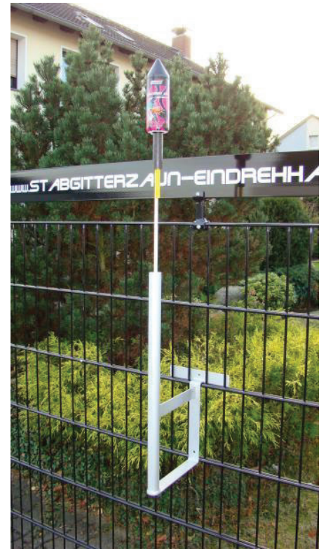
Eindrehhalterung Gartenfackeln und Sylvesterraketen RAL 7016 Anthrazit u. RAL 6005 Moosgrün